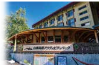
アクティビティパーク