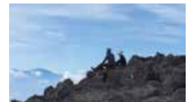
登山(日本百名山 蓼科山)