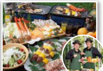
バーベキュー(チロルガーデン) ホテル専属バーベキューインストラクター