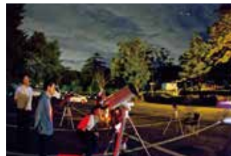
毎日開催! ホテル専属星空の案内人【星空レンジャー】と楽しむ星空ツアー