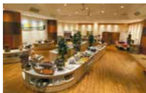
レストラン ジン・マリール