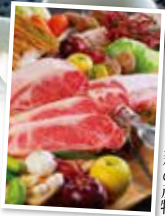
信州の恵み 立料の産物

高原ならではの味わいを生かした和・洋料理を何でも好きなだけ、レストランでお召し上がりください。バイキングや会席料理などの他に、ランチや休憩に便利な麺類や喫茶も用意しました。