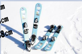
滑雪課程專用雪板

苗場, 輕井澤等是受歡迎的兒童滑雪場! 適合3-9歲的小朋友專用的滑雪課程, 讓他們在愉快氣氛中更易學習滑雪技能!! 課程已包含租用雪具, 不需要額外準備!